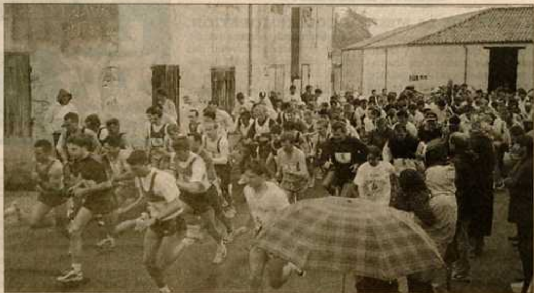
Le départ d'une course originale