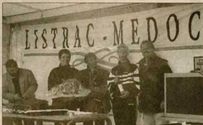
Les vainqueurs féminines

C'est sous les applaudissements d'une foule très nombreuse que